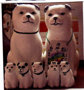
米沢在住だった福島犬も一緒に福島に戻り7匹になりました。

夫帰りを合わせて、新たな"1000"に向かって歩んで参ります。これからもどうぞよろしくお願い申し上げます。震災から4年、我家はふくしまに帰らせていただきましたが、未だ帰還できない避難地域の方々が多くいます。先日、浪江町の方が、"一時帰宅する度に、地域の家が傷んでゆく姿を見ると、とても悲しい気持ちになる"とおっしゃっていたのを聞き、心が痛みました。微力ですが自分に何か少しでも出来る事を見つけてながら、それを続けてゆけたらと思っています。小さくおと寄りおえまきと、とてもあなたかくなりすね。