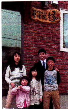
3年半前のふくしまに2...

米沢へ避難した時、2才だった三女も5才半になりました。人生の半分以上を彼女は米沢で過ごしました。私達家族にとって米沢は、一生忘れられない才2のふる里です。たくさん思い出をありがとうごさいました。長男は小学教員を目指し、東北福祉大学へ。長女は妻の母校、福島西高校へ入学いたしました。大学、高校、中学、小学、保育所と