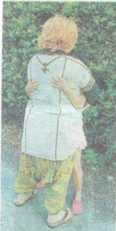
自主避難先の住宅前で娘を抱きしめる女性＝5月25日、熊本県内

「放射能に不安を感じて、逃げることももう許されないのか」。無償提供打ち切りを受け、40代女性はいう。女性は福島県内の自宅から1千キロほど離れた熊本県で子ども2人と避難生活を続けている。