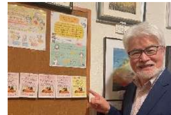
早速チケットのご寄付をいただきました。

「今月お財布がピンチ！」「今月は誰かに恩を送ってみよう！」 「なんだか誰かを笑顔にしたい気分…！」そんなときには「お互いさまチケット」！ 仕組みを導入している店舗・企業へ行けば、見知らぬ誰かの為に恩送りができたり、無料もしくは低価格で商品を購入したり、サービスを受けたりすることができます。自分自身が恩を受けることも、他の人へ恩を送ることもできる下記の取り組みが、福島そして日本をもっともっと豊かな街へ変えてくれると夢見ています。 縁のお互いさまチケットは、1,000円と5,000円の2種類。整体・商品購入に使えます。