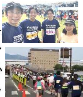
あずま陸橋のランナーの波↑

5月19日ふくしまハーフマラソンに、妻と長男、次男と4人で参加しました。去年の初回に続き2度目のハーフマラソンでした。五月晴れの下、約3500人の参加者が福島市内を駆けました。予想気温29℃で暑くなるかと思いましたが、途中雲がかかってくれて、さほどの暑さを感じずに走れました。右道で、地元町内会や近所のお客さんに、たくさんのお応援をいただき、とても励みになりました。応援の力ですごいですね！