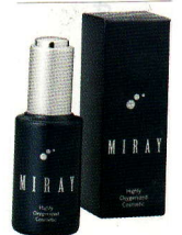
エクセレントオイル

アルガンオイルはモロッコ南西部のサハラ砂漠だけにしか存在しない「アルガンツリー」の果実100kgからわずか1kgしか採れない希少性の高いオイルです。