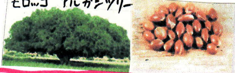
モロッコ アルガンツリー

アルガンオイルはモロッコ南西部のサハラ砂漠だけにしか存在しない「アルガンツリー」の果実100kgからわずか1kgしか採れない希少性の高いオイルです。